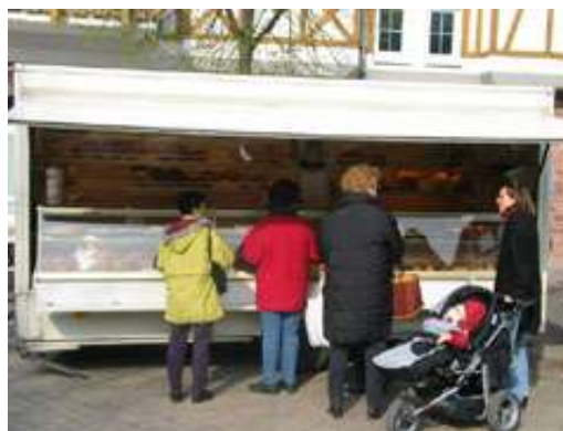
Richards Backhaus Iss' besser!