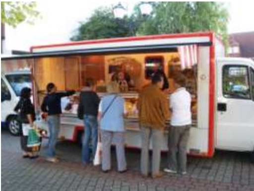
Tiroler Spezialitäten Franke