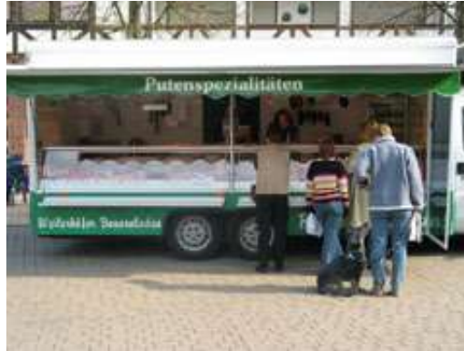
Weilerhöfer Bauernladen Putenspezialitäten Reinmuth