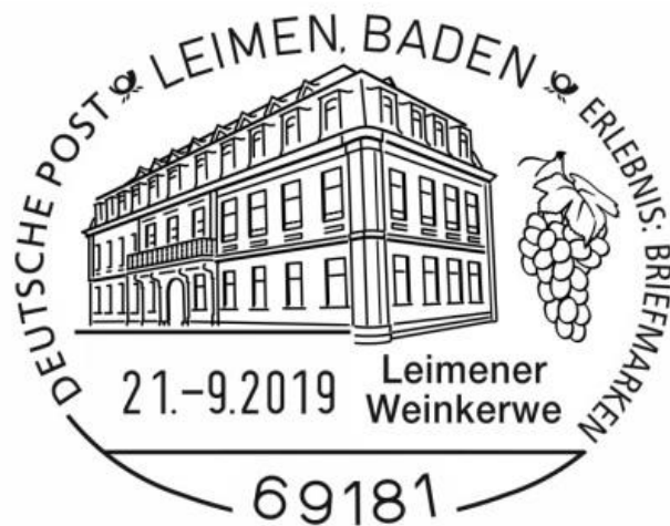
Sonderstempel zur Weinkerwe 2019

Die Auflage beträgt 2.000 Stück. Die Marken können am Kerwesamstag zwischen 9 und 16 Uhr am Stand des Vereins gegenüber der Post in der Rathausstraße zum Preis von 1,50 €/Stück erworben werden. Zusammen mit dem Schmuckumschlag und dem passenden Sonderstempel hat man so ein hübsches Andenken an die 48. Leimener Weinkerwe, das auch den Beginn eines faszinierenden Hobbys darstellen kann. Am Stand berät man sie gerne!